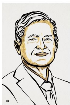
III. Niklas Elmehed Ferenc Krausz Prize share: 1/3