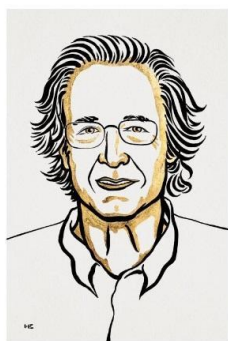
III. Niklas Elmehed © Nobel Prize Outreach Pierre Agostini Prize share: 1/3