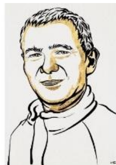
Mounqi G. Bawendi Prize share: 1/3