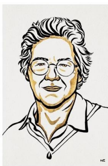
Anne L'Huillier Prize share: 1/3