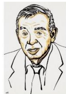
Alexei I. Ekimov Prize share: 1/3

Nobel Prize in Chemistry 2023 awarded to Mounqi G. Bawendi, Louis E. Brus and Alexei I. Ekimov