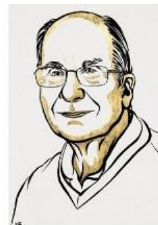
III. Niklas Elmehed © Nobel Prize Outreach Louis E. Brus Prize share: 1/3