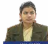
KM JYOTI RANK - 19